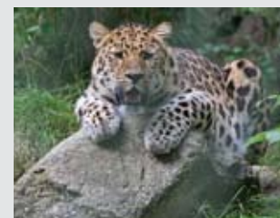
▲ Den här snöleoparden kommer att trivas vid björnparken i Orsa Grönklitt.