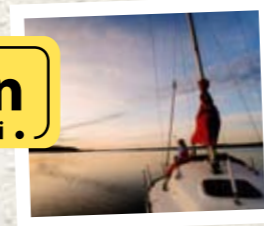
Båttur från Kristinehamn på Värmen.

Anledningen till att det gamla namnet behålls är att de tidigare kunderna till Bro Måleri inte ska uppleva någon skillnad genom att Miljönären nu kommit in i bilden. Verksamheten fortsätter som vanligt.