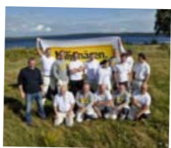
Miljönären vid Värmen.