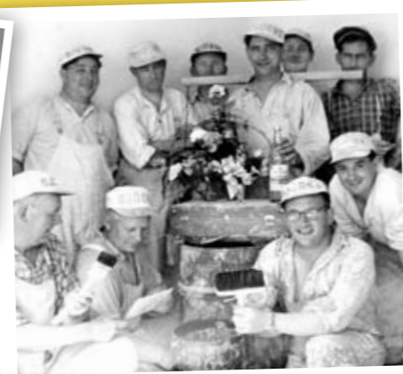
Första arbetslaget som representerade det företag som i dag heter Miljönären. Bilden är tagen den 6 september 1944.