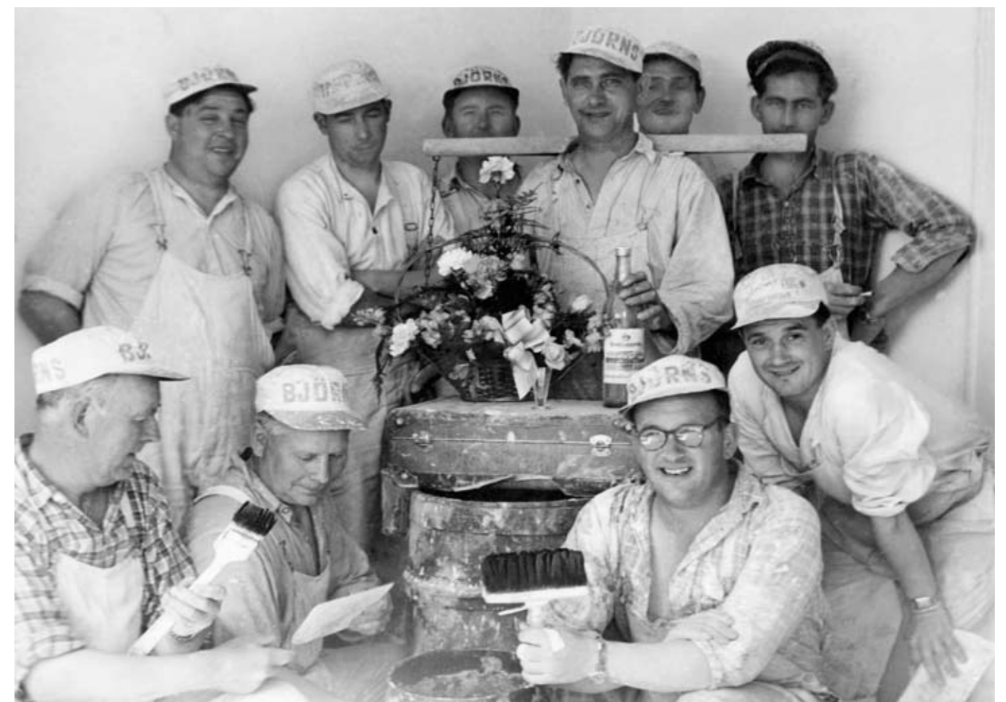
Miljönärens första arbetslag 6 September 1944.

” Miljönären erbjuder numera en helhetslösning när det gäller målning och renovering av rummets alla delar. Det gäller alltså även golvläggning.